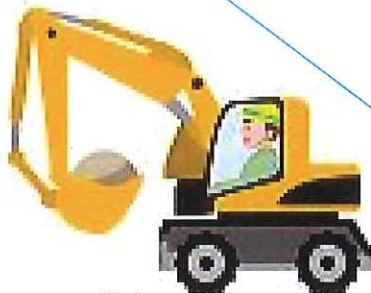
パワーしょべる (パワーシヨベル)