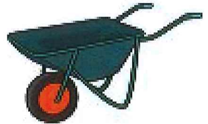
いちりんしゃ (一輪車)