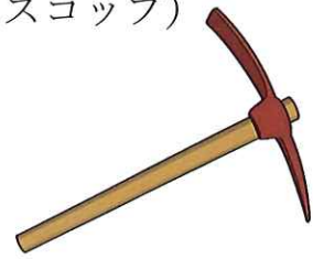
つるはし (ツルハシ)