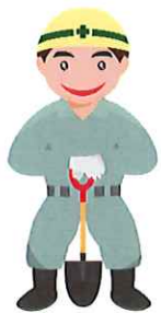
さぎょういん (作業員)