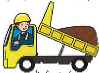
とらつく (トラック)