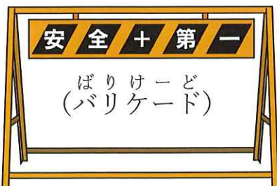
あんぜん 第一 ばりけーど (バリケード)