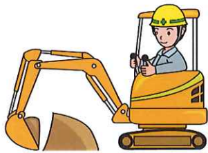
しょべるカー (シヨベルカー)