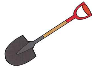
すこっぷ (スコップ)