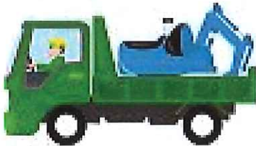
だんぷカー (ダンプカー)